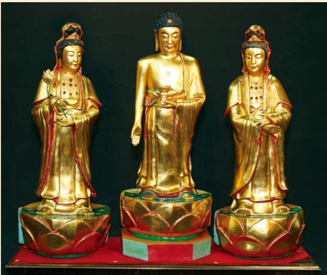
■鎮殿三接引：阿彌陀佛、觀世音菩薩、大勢至菩薩