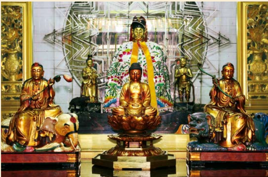
■華嚴三聖：釋迦牟尼佛與文殊菩薩、普賢菩薩